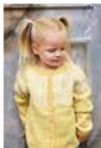
RYGJA KOFTE Sisu Design 11