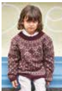
RYGJA GENSER Tynn Merinoull Design 9