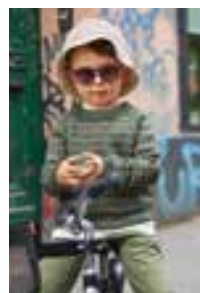
NORDSJØ GENSER Babyull Lanett Design 4