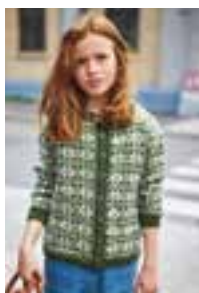
MYRDALSKOFTE Sisu Design 1