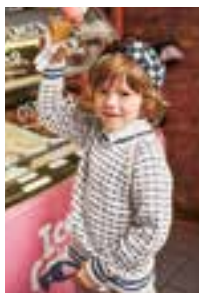
ISLENDER GENSER Sisu Design 5