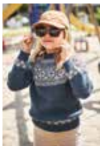
BØVERTUN GENSER Mini Alpukka Design 10