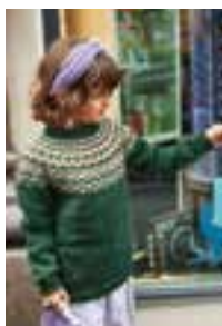
GRO GENSER Merinoull Design 2