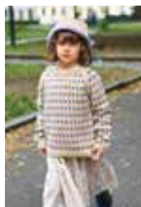
NORDSJØ GENSER Peer Gynt Design 3