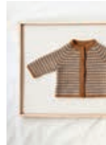
HEKLET STRIPE JAKKE Design 11