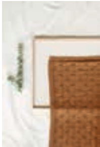
KLØVERTEPPE Design 2