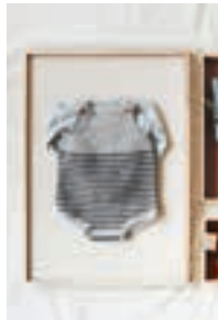
HEKLET ROMPER Design 10