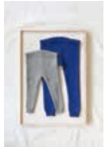
BUKSE Design 6