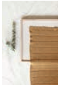
HALVPATENT TEPPE Design 5