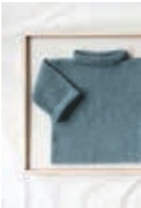
LILLE TRILLE GENSER Design 8