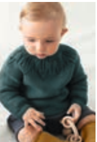
BLÅKLOKKE GENSER Design 13