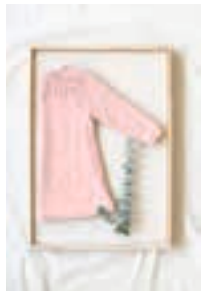
BLÅKLOKKE KJOLE Design 12