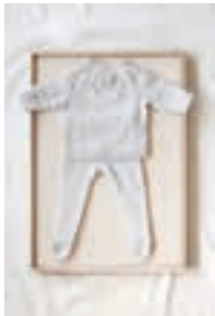
STRØMPEBUKSE Design 12