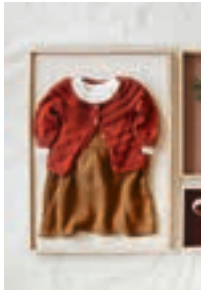
KLØVERJAKKE Design 1