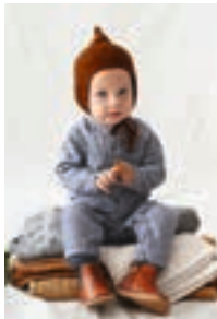
LILLE TRILLE PIXIELUE Design 9