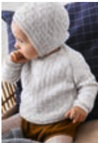
SPIREJAKKE, KYSE Design 15