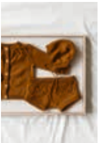
BLÅKLOKKE JAKKE, BLEIEBUKSE, KYSE Design 14