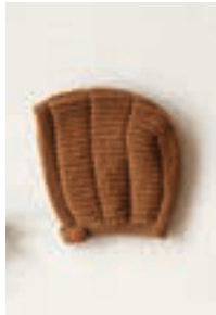
HALVPATENT KYSE Design 3