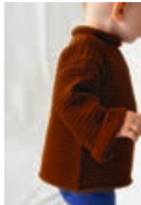
LILLE TRILLE GENSER Design 7