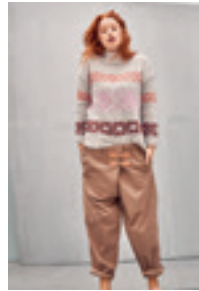
INKAGENSER Design 10