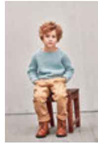
FALSK PATENT GENSER Design 5