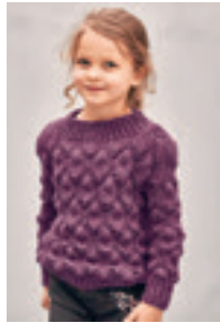
KLOKKEGENSER Design 9