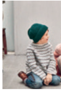
LUE Design 4