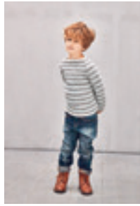
DAISY GENSER Design 3