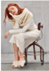
HALS Design 7