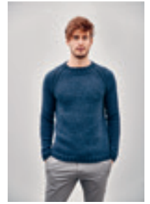
BASIC RAGLANGENSER Design 6