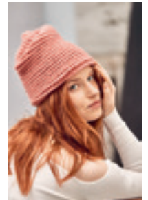
RELIEFF LUE Design 18