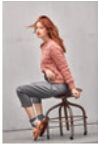
KLOKKE GENSER Design 2