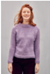
RAGLANGENSER Design 13