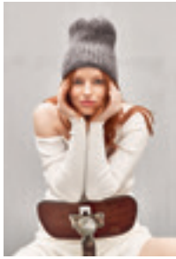
RIBBLUE Design 1