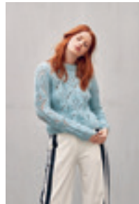
HULLMØNSTER GENSER Design 16