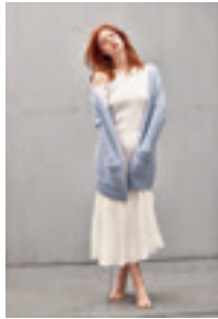
LANG JAKKE Design 8