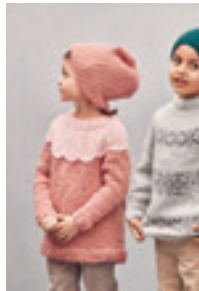
BLADBORD GENSER Design 15