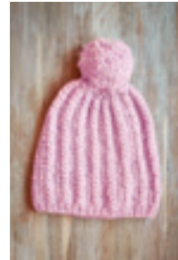
FLETTE LUE Design 17