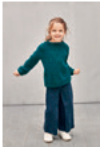
ENKEL RAGLANGENSER Design 14