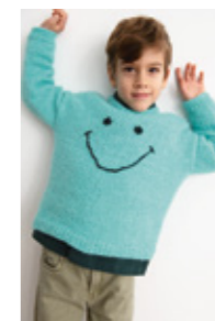
BIG SMILEY GENSER Kos Design 10

EVENTUELLE RETTELSE TIL DETTE HEFTET FINNER DU PÅ SANDNESGARN.NO