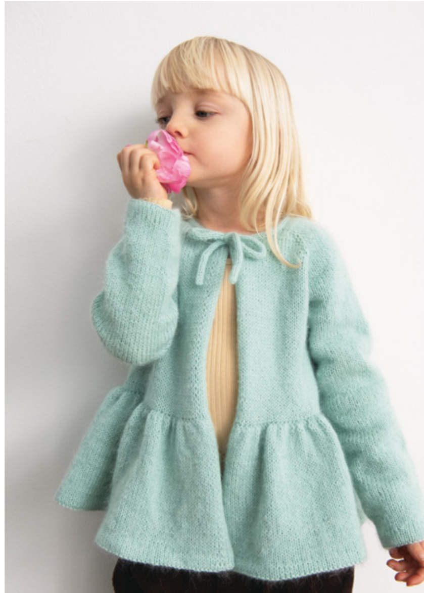
2303 | SUNDAY | TYNNSILK MOHAIR | 4 | 21 | 10 | VIENNA CARDIGAN | 2-12 ÅR (ovenfra og ned)