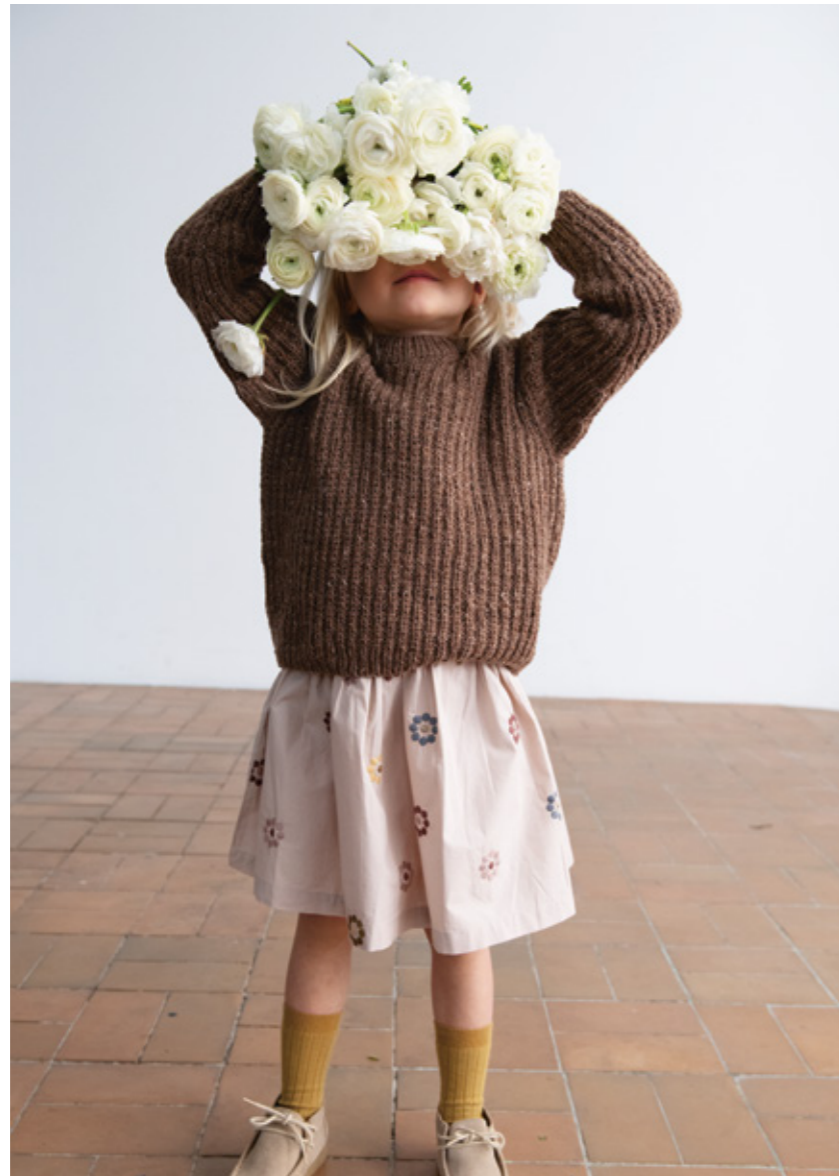
2303 | TWEED RECYCLED | ✕ 4 | 18 | 10 | ... LOUI GENSER 1 | eller DOUBLE SUNDAY | 2-12 ÅR (ovenfra og ned)