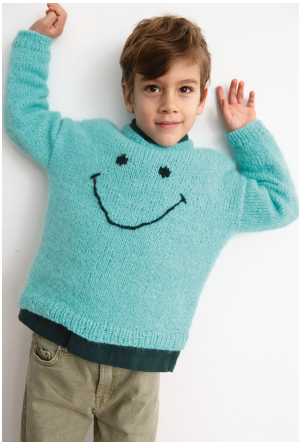
2303 | KOS | 4 1/2 | 18 | 10 | ●●● BIG SMILEY GENSER | 2-12 ÅR (ovenfra og ned)