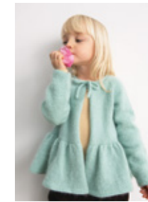
VIENNA CARDIGAN Sunday Tynn Silk Mohair Design 3