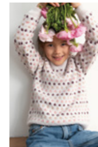
FLEURDE LIS GENSER Tynn Merinoull Design 6