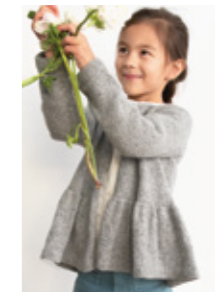
VIENNA CARDIGAN Tweed Recycled Design 7