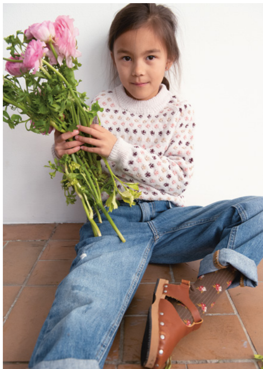
2303 | TYNN MERINOULL | \times 3 | \frac{\text{AAA}}{27 | 10} | ... FLEUR DE LIS GENSER 6 | 2-12 ÅR (nedenfra og opp)