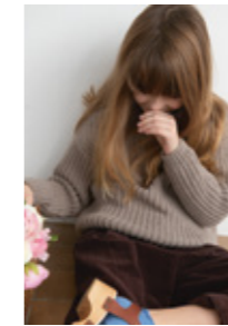
LOUI GENSER Double Sunday Design 1