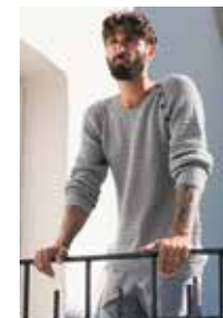
AUGUST SEILERGENSER Sunday Design 6