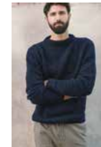
JESPERGENSER Kos Design 4