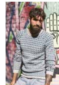
PELLEGENSER Babyull Lanett Design 7