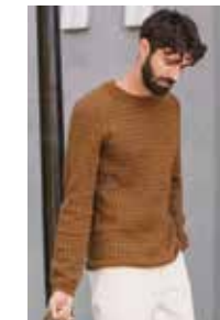
NORDSJØ Mini Alpukka Design 5