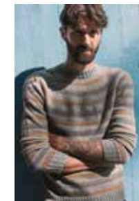
HINDERGENSER Tynn Merinoull Design 8