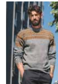
MARIUS Sisu Design 3