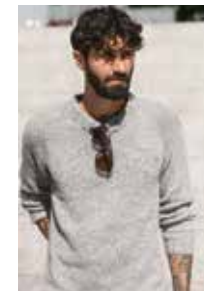
MRCASUAL Kos Design 1