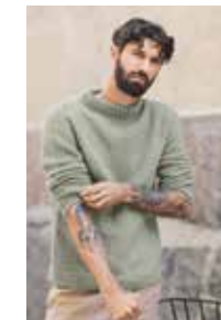
JESPERGENSER Kos Design 4